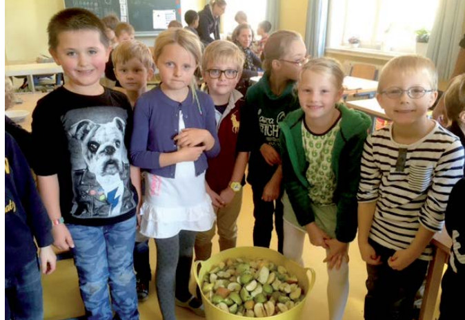
Selbst pflücken, schneiden und zu Saft pressen: Erstklässler nach getaner Arbeit während der Projektwoche zum Thema Apfel