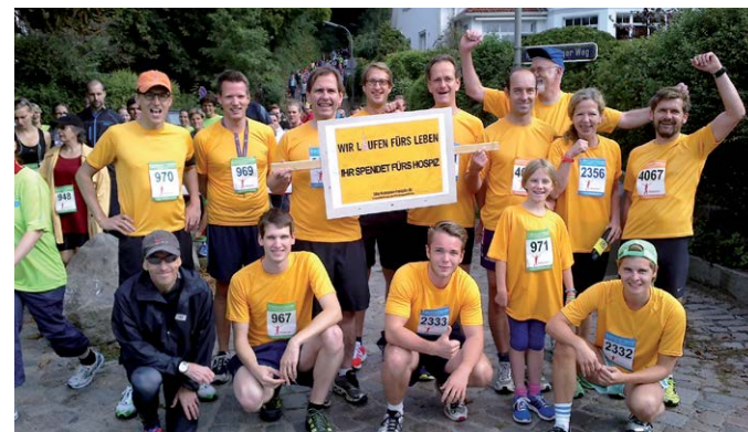
Sportliches Engagement für das Hospiz: Heldenläufer-Team