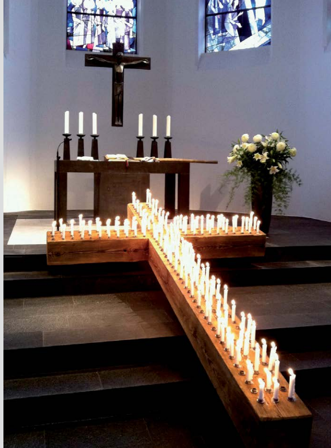
Ewigkeitssonntag: Lichterkreuz im Altarraum

26.07. Flüchtlingshilfe: 307,43 | 02.08. Fonds f. Gerechtigkeit und Versöhnung: 198,90 | 09.08. Chorprojekt | Christl.-Jüd. Dialog: 250,79 | 16.08. Seemannsmission: 261,73 | 23.08.