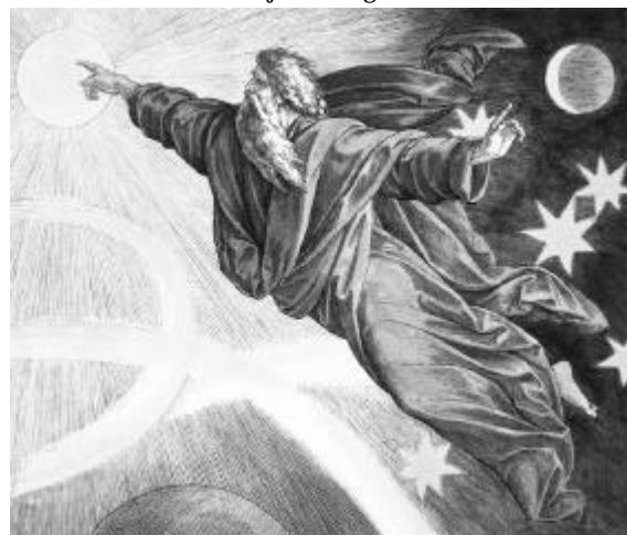
„Der vierte Schöpfungstag“ von Julius Schnorr von Carolsfeld (Bild: Ullstein/AKG-Images)

Um der Bewahrung der Schöpfung und des Überlebens der Menschheit willen erscheint es uns notwendig, die Versuche, ein neues naturwissenschaftliches Weltbild zu formulieren, mit biblisch-theologischen Traditionen in Kontakt zu bringen. Diese Reihe wird im zweiten Halbjahr fortgesetzt.