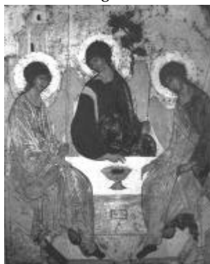
Heilige Dreifaltigkeit - Rubljow Ikone 15 Jh.

Für den menschlichen Geist sind einheitliche Zentralperspektiven wichtig: mein Ich ist eines, meine Welt ist eine, der Schöpfer der Welt ist einer! Nur darin kann der Geist zur Ruhe kommen. Was aber ist es, was durch die Zentralperspektive vereint wird, wenn nicht vieles?! Mein Ich ist reich an höchst gegensätzlichen Epochen und Regionen, nicht anders meine Welt, und auch Gott offenbart sich in seinem ganzen Reichtum. Nicht zuletzt ist er nicht nur mein Gott, sondern auch der anderer. Bin ich bereit, das nicht nur zu ertragen, sondern zu begrüßen?